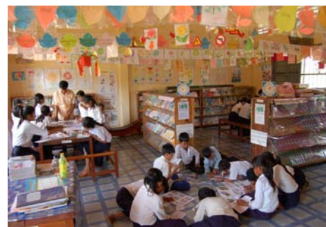
カンボジアに寄贈された図書室

今回のキャンペーンでは、ズワンストラ財団よりルーム・トゥ・リード東京チャプターへマatching Grant のお申し出として US 5 万ドルの助成金をいただくことになりました。この助成金は、東京近郊の学校に通う学生たちが自分たちの力で集めた寄付金と同額を付与し、図書室をつくることに使われます。